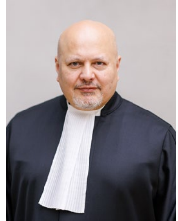
كريم أ. أ. خان، مستشار الملك المدعي العام للمحكمة الجنائية الدولية