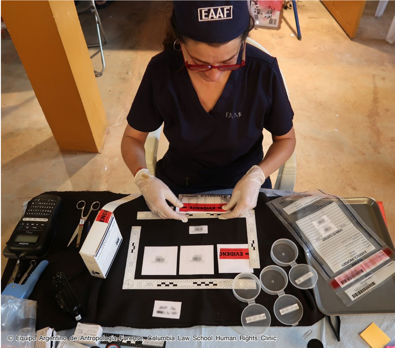
© Equipo Argentino de Antropología Forense, Columbia Law School Human Rights Clinic

قد تكون الأشياء المادية (أو الآثار) مصادر للمعلومات المهمة. وقد تشمل هذه الأشياء، على سبيل المثال لا الحصر، الملابس والأسلحة والذخيرة والوثائق المطبوعة والأجهزة الإلكترونية والوسائط الناقلة. وينبغي، إن أمكن، جمع الأشياء المادية المستخدمة في سياق الإجراءات القضائية، وفقا لإجراءات الأدلة الجنائية الرامية إلى ضمان جمعها ومناولتها وتعبئتها ونقلها وتخزينها وحفظها على النحو الملائم، من أجل الحفاظ على سلامتها وقيمتها الثبوتية.